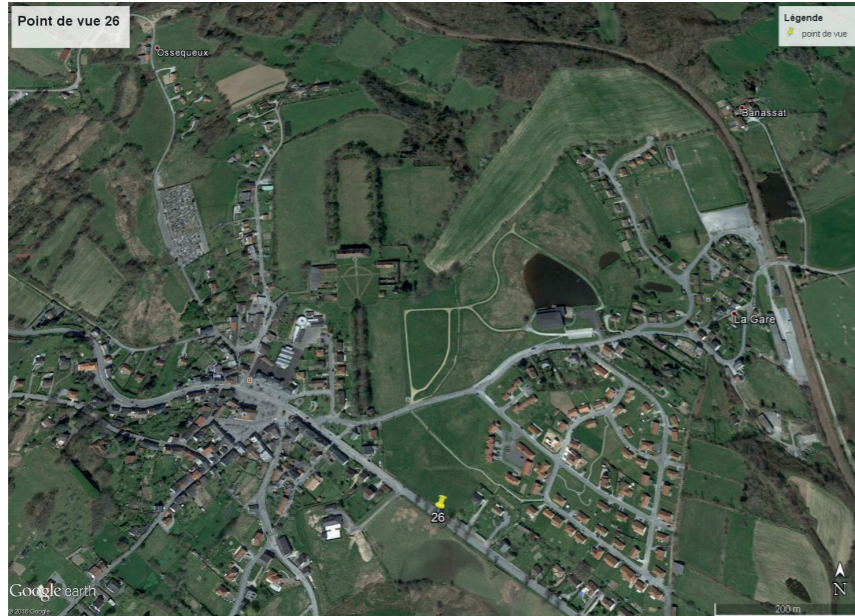
Contexte du point de vue (éoliennes non représentées)