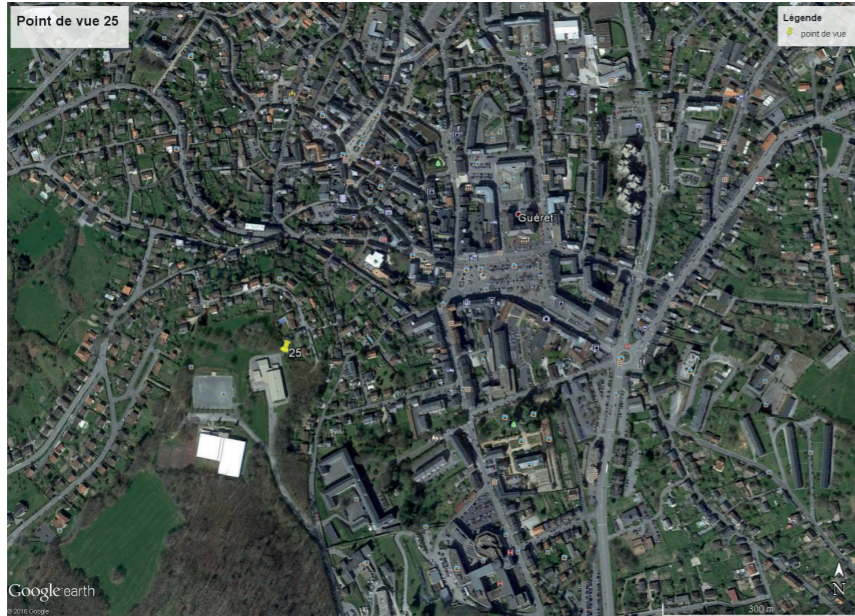
Contexte du point de vue (éoliennes non représentées)